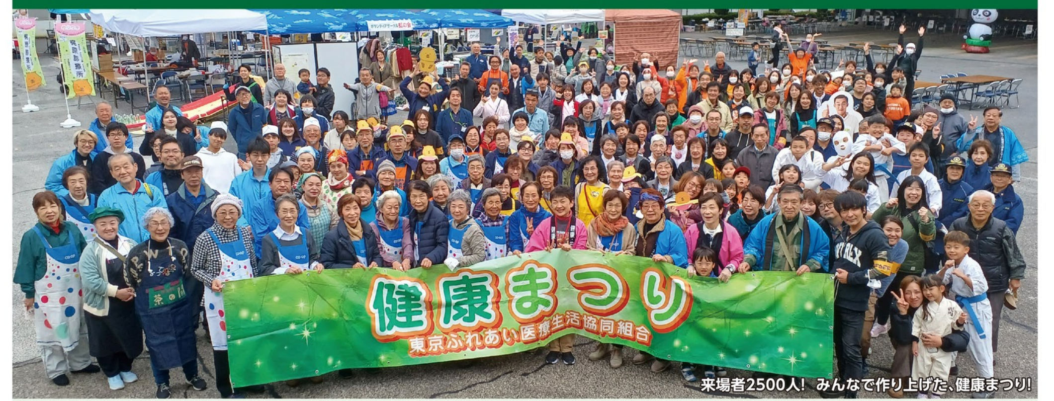
来場者2500人! みんなで作り上げた、健康まつり!

2024年10月1日から12月1日にかけて開催いたしました「オールふれあいco-op月間」では、安心して暮らせる地域づくりを目指し、職員・組合員一丸となって組織基盤の強化に取り組みしました。 この期間中に実施いたしました健康チャレンジ(今回は減塩について学びました)、プラスチックごみと環境問題に関する学習会、そして自分の死を考える会など、様々な取り組みを通して、地域住民の皆様とともに健康や環境問題、そして人生について深く考える機会を設けました。 特に、健康まつりには2500名もの方にご来場いただき、地域全体で盛り上がることができ、大変感謝しております。 今後も、地域住民の皆様とともに、健康で安心して暮らせるまちづくりを目指し、様々な活動を進めてまいります。引き続き、ご理解とご協力をお願い申し上げます。