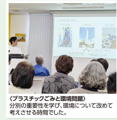
〈プラスチックごみと環境問題〉 分別の重要性を学び、環境について改めて考えさせる時間でした。