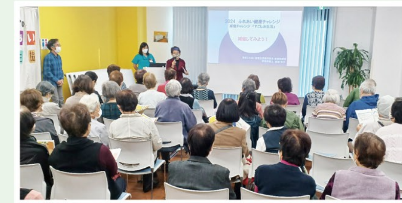
〈健康チャレンジ〉 98名がチャレンジ!! 減塩できたかな?細く長く頑張ろう!!